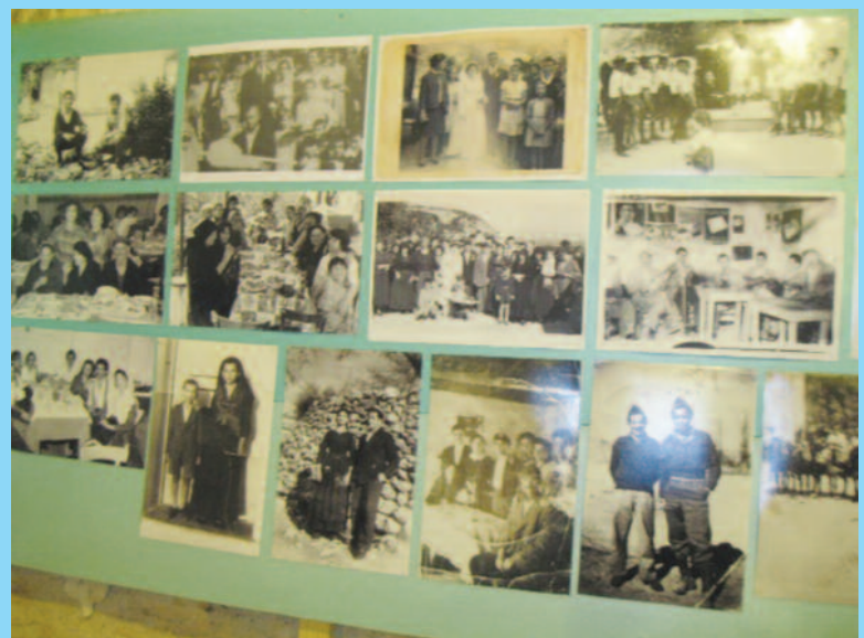
Από την Έκθεση Φωτογραφίας