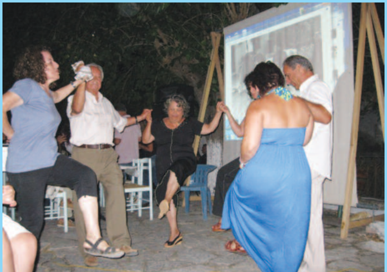
Από το γλέντι μετά την εκδήλωση