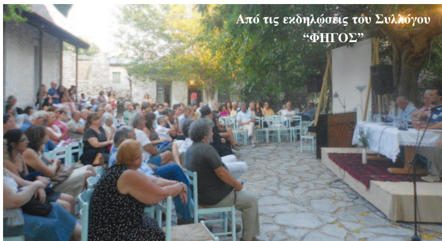
Από τις εκδηλώσεις του Συλλόγου "ΦΗΓΟΣ"