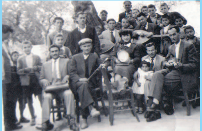
Η φωτογραφία είναι στην πλατεία στον Αλέξανδρο από παλιό γλέντι