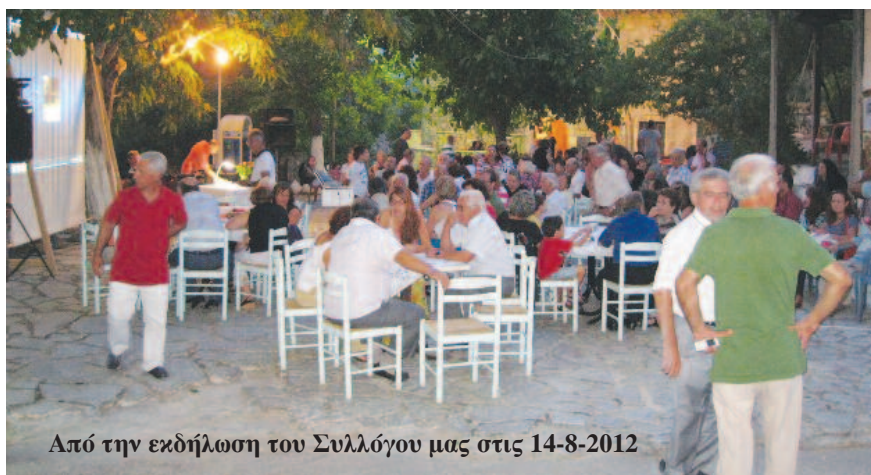
Από την εκδήλωση του Συλλόγου μας στις 14-8-2012