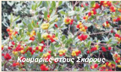
Κουμαριές στους Σκάρους

✓ Επανερχόμαστε τώρα που νομίζουμε ότι είναι η κατάλληλη εποχή για το κλάδεμα των δέντρων στις πλατείες Κολυβάτων και Αλέξανδρου και του Περναριού στην Παναγία και όποιων άλλων δέντρων ανήκουν σε κοινοτικούς χώρους.