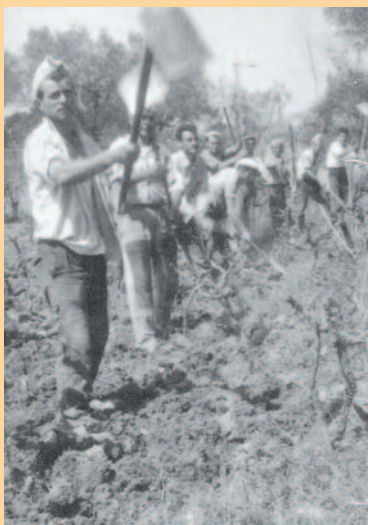
Χωριανοί μας στο Ξενοδούλειο με τον πρωταργάτη, το μασκαλιάρη, τον τρίτο, ..... και τον κωλαργάτη.

Στην ίδια χρονική περίοδο για τα χωριά κυρίως στη Λευκάδα υπήρχε και το ΞΕΝΟΔΟΥΛΕΙΟ μια ιδιότυπη μετανάστευση, βραχυχρόνια κι εποχική, προς το Ξηρόμερο και