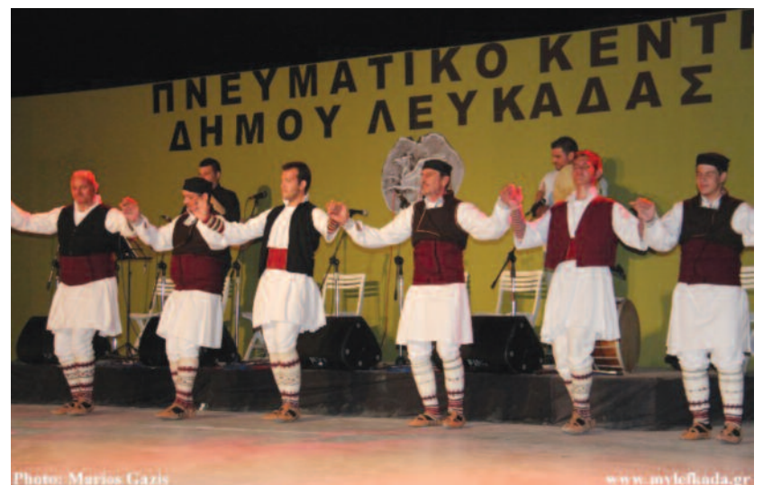
ΠΟΛΙΤΙΣΤΙΚΟΣ ΣΥΛΛΟΓΟΣ ΝΙΚΙΑΝΑΣ ΛΕΥΚΑΔΑΣ «ΟΙ ΣΚΑΡΟΙ»

Επιτυχημένη εκδρομή πραγματοποιήσε ο Σύλλογος Νικιάνας «Οι Σκάροι» από τις 6-9-2013 έως τις 9-9-2013 στο νησί της Πάτμου.