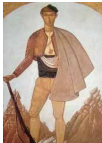
Ο Μακεδονομάχος, 1926