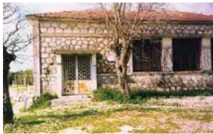
Δημοτικό Σχολείο Χορτάτων

Στον τοίχο του Σχολείου ήταν αναρτημένη η εικόνα του Χριστού και ολόγυρα μορφές των πρώων του '21, έτοιμες λες να ζωντανέψουν σε κάθε επέτειο των εθνικών γιορτών, με τα εντυπωσιακά σκετσ, τα πρωικά ποιήματα, που όλα τα παιδιά απαγγέλλαμε, και τους παραδοσιακούς χορούς. Αλλά και στο τέλος της σχολικής χρονιάς γινόταν η σχετική γιορτή, μέσα σε πανηγυρική ατμόσφαιρα, αφού αποχαιρετούσαμε το σχολείο. Τότε οι σχολικές γιορτές ήταν κάτι σημαντικό για το χωριό, μιας και δεν υπήρχαν πολλές ευκαιρίες να ξεφύγει κανείς από τις καθημερινές σκοτούρες. Πόσα και πόσα πράγματα δε μάθαμε