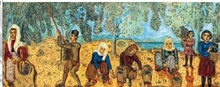
[Φωτο: Λαϊκός ζωγράφος Θεόφιλος: «Το μάζεμα των ελαιών»]