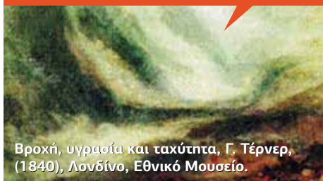
Βροχή, υγρασία και ταχύτητα, Γ. Τέρνερ, (1840), Λονδίνο, Εθνικό Μουσείο.

«... χειμώνιασε και φύγανε τα κελιδόνια γέμισαν οι δρόμοι λάκκου με νερό δυο μαύρα σύννεφα στον ουρανό κοιτάζονται στα μάτια αγριεμένα αύριο θα βγει στους δρόμους και η βροχή απελπισμένη μοιράζοντας τις ομπρέλες της ...» Μίλτος Σαχτούρης, Τα φάσματα ή η χαρά στον άλλο δρόμο.