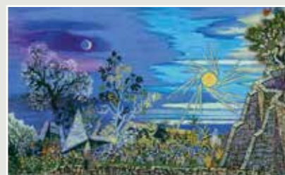
Φωτο: Νίκος Χατζηκυριάκος-Γκίκας Το πρώτο πρωί του κόσμου