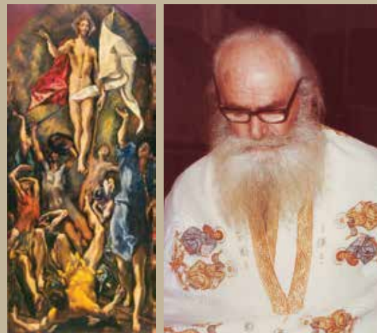
[Αριστερά Η Ανάσταση (Δομήνικου Θεοτοκόπουλου)]

«Πάσχα Ιερόν» το πάλοι ποτέ εν Χορτάτοις, Κομπλιώ, Μανάση, Νικολή, Αγίω Βασιλείω, του Παπαγιώργη ιερουργούντος