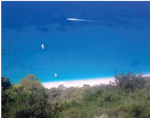
Οι Εγκρεμνοί

Το CNN παρουσίασε τη λίστα με τις, κατά την κρίση του, 100 καλύτερες παραλίες του κόσμου, στην οποία έχουν συμπεριληφθεί τέσσερις ελληνικές παραλίες. Ψηλότερα από όλους τους «εκπροσώπους» της Ελλάδας στο διαγωνισμό, με βάση μαρτυρίες, σχόλια και φωτογραφίες από το κοινό, κατέλαβαν οι Εγκρεμνοί στη Λευκάδα (24η θέση). Ακολουθούν το Ναυάγιο στη Ζάκυνθο (32η θέση), ο Μπάλος στα Χανιά (35η θέση) και τα Φαλάσαρνα επίσης στα Χανιά (100η θέση). Για τους Εγκρεμνούς το δημοσίευμα αναφέρει ότι οι επισκέπτες θα απολαύσουν εκπληκτικά ηλιοβασιλέματα, απεριόριστο ελεύθερο χώρο και καταγάλανα νερά. Κάτι μας είπαν, τώρα! Ωστόσο, αντίστοιχη ποιοτική έρευνα (μίνι ή μάλλον ... μικρίκι συνεντεύξεις) της εφημερίδας «Τα Χορτάτα» με τυχαίο δείγμα φίλων ανέδειξε τους Εγκρεμνούς στην πρώτη θέση της αντίστοιχης λίστας, ενώ παράλληλα από τις υπόλοιπες 99 καπάρωσαν 9 θέσεις άλλες παραλίες της Λευκάδας, που δεν τις αποκαλύπτουμε για ευνόητους – για κάποιους ίσως και ακατανόητους - λόγους. Επισημαίνουμε μόνο ότι οι περισσότερες από αυτές βρίσκονται στις δυτικές ακτές του νησιού – συγγνώμη, συντοπίτες που βρίσκεστε ανατολικά της Εδέμ -, ενώ τις υπόλοιπες μοιράζονται η ανατολική ακτή, το Μεγανήσι και ο Κάλαμος.