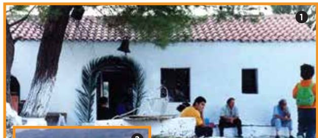
1. Η Παναγία η Ελεούσα