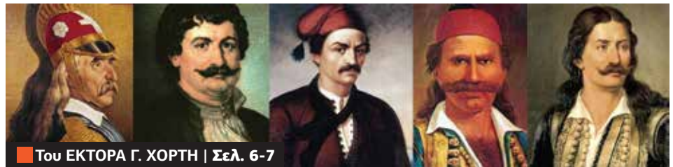
Του ΕΚΤΟΡΑ Γ. ΧΟΡΤΗ | Σελ. 6-7