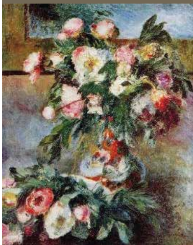
Γλυκάσκαμνα (παιωνίες) Πιερ Ρενουάρ, 1878

Γλυκάσκαμνα αρυτίδιαστα με παχύ στρώμα πορφυρού και φόντο τους τη δέμπλα, που ιμπρεσιονιστικά η σκιά τους φωτίζει ήλιος πλαστικούς παίζοντας με το φως μες στη χορτιώτικη αυλή. Σε βάζο τα 'βαλε κι ο Ρενουάρ, για να μας γνέφουνε κρυφά, έστω και ως μποκέδες (Ε.Γ.Χόρτης).