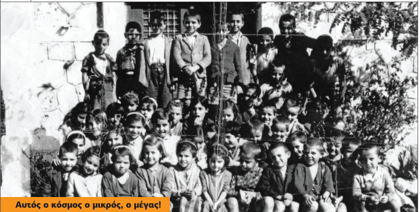
Αυτός ο κόσμος ο μικρός, ο μέγας!