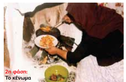
2η φάση: Το κένωμα