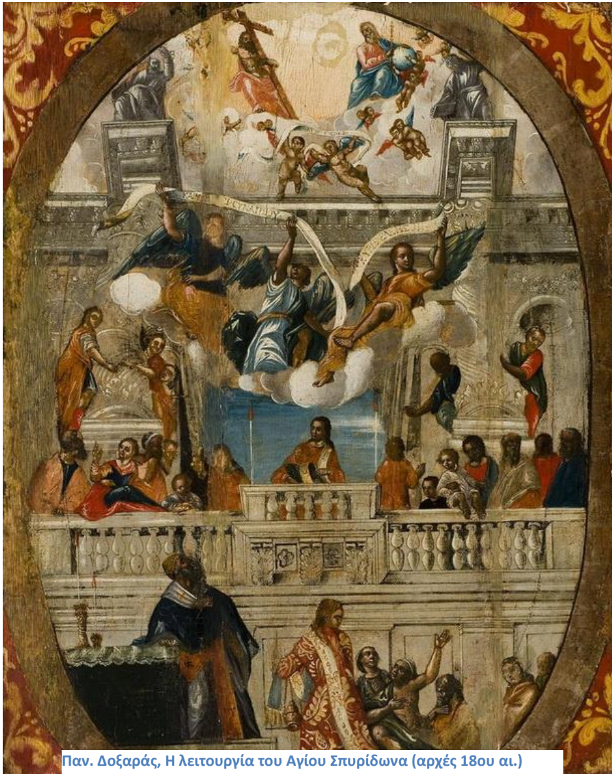
Παν. Δοξαράς, Η λειτουργία του Αγίου Σπυρίδωνα (αρχές 18ου αι.)