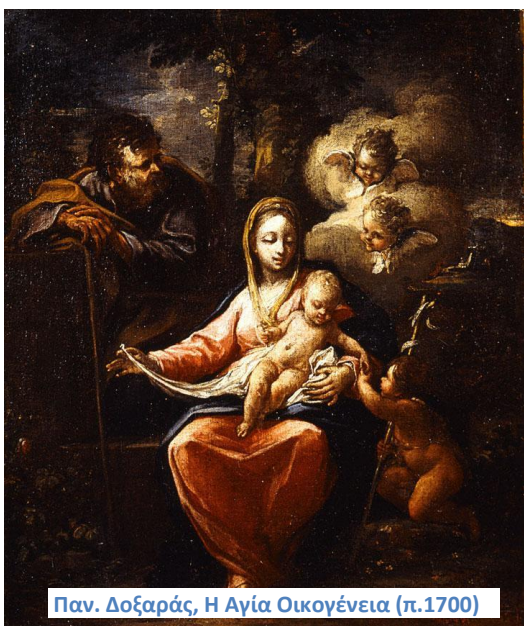
Παν. Δοξαράς, Η Αγία Οικογένεια (π.1700)

Η διαθήκη την οποία θα σχολιάσουμε ήταν συνταγμένη, σε γενικές γραμμές, σύμφωνα με τον τύπο των διαθηκών της εποχής που συνέτασσαν οι νοτάριοι του νησιού. Η εγκυρότητα του εγγράφου προϋπέθετε να είναι οι διαθέτες υγιείς πνευματικά, πράγμα το οποίο επιβεβαιώναν ο νοτάριος και οι παριστάμενοι μάρτυρες στις συνταγμένες από νοταρίου διαθήκες. Στην περίπτωση μας, ο Δοξαράς βεβαιώνει ο ίδιος στην αρχή του εγγράφου ότι είναι υγιής σωματικά και έχει σώας τας φρένας. Ωστόσο, φοβούμενος τον αιφνίδιο θάνατο, αποφασίζει να συντάξει τη διαθήκη του, ώστε να μην τελειώσει την επίγεια ζωή του «αδιόρθωτος», όπως χαρακτηριστικά αναφέρει. Ο όρος αδιόρθωτος έχει διπλή σημασία. Αφορά αφενός τα σχετικά με τα περιουσιακά στοιχεία του διαθέτη και γενικώς με τις οικονομικές του εκκρεμότητες (κινητή και ακίνητη περιουσία, πιθανά χρέη και πιστώσεις κ.λπ.) και αφετέρου την προετοιμασία για τη μετάβασή του στην «Άνω Ιερουσαλήμ», δηλαδή στην άλλη ζωή, που σχετίζεται με την κάθαρση της ψυχής του από τον ρύπο της αμαρτίας, αλλά και με πρακτικά ζητήματα, όπως π.χ. ο τόπος της ταφής του κ.λπ.