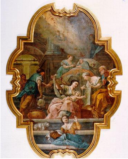
Παναγιώτης Δοξαράς, Το Γενέσιο της Παναγίας