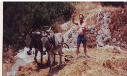
Χορτάτα 1990: Και τ' άχερο καρπό

Για το περιεχόμενο των ενυπόγραφων κειμένων ευθύνονται οι συγγραφείς τους