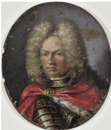
Παν. Δοξαράς, Προσωπογραφία του κόμη Johann Mathias von der Schulenburg (1725), αρχιστράτηγου των Βενετών και υπερασπιστή της Κέρκυρας

υπογράφει. Υπογράφει επίσης ο γασάλδος (επίτροπος) της εκκλησίας Αντώνης Μαυρογιάννης.