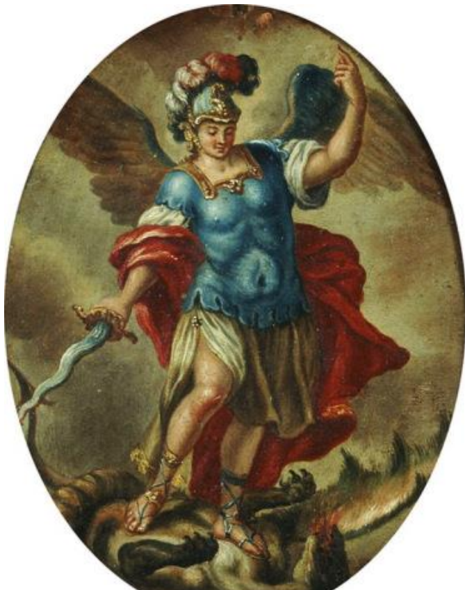
Παναγιώτης Δοξαράς, Ο αρχάγγελος Μιχαήλ

επιθυμεί να ταφεί το «πήλινο», όπως το χαρακτηρίζει, σώμα του στον ναό του Αγίου Δημητρίου, στον τάφο της συζύγου του. Ο χαρακτηρισμός του σώματος ως πήλινου χρησιμοποιείται στην υποδηλούμενη αντίθεσή του με την αιώνια, την άφθαρτη