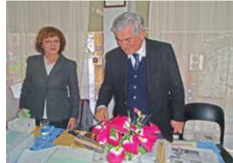
Ο κ. Χρυσικός