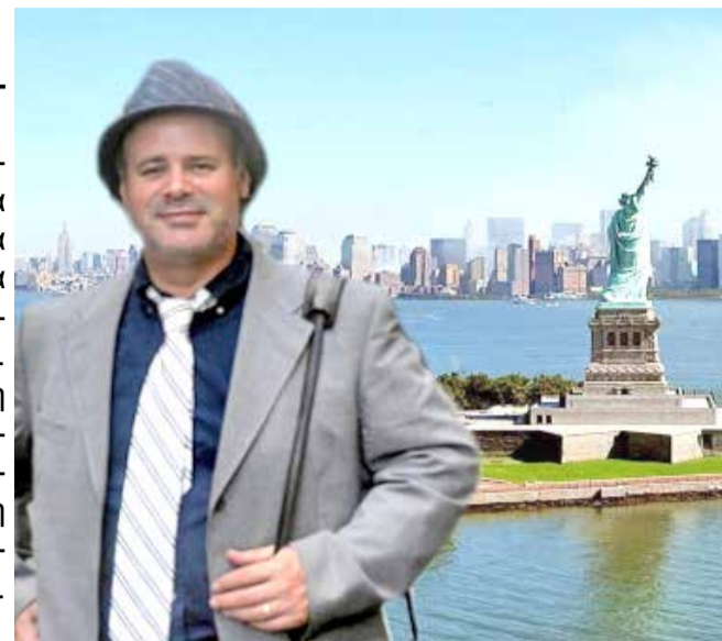
Το άγαλμα της Ελευθερίας

Σχεδόν κάθε χρόνο ίσως και δύο φορές την ίδια χρονιά. Το πρόβλημα είναι ότι τους καλοκαιρινούς μήνες όλοι τρέχουν και δουλεύουν και είναι δύσκολο να βρεθώ με φίλους και γνωστούς στην άνεση του χρό-