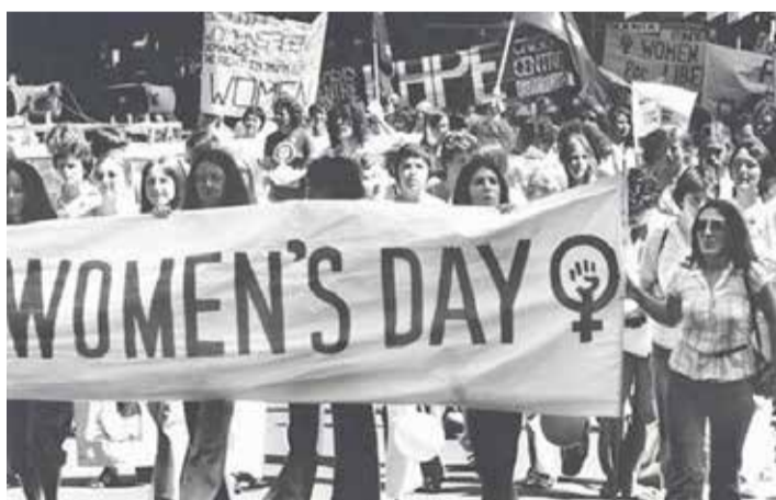
Ημέρα των γυναικών

και τη χειραφέτησή τους για την κατάκτηση της ισότητας, για την αναμόρφωση του Οικογενειακού