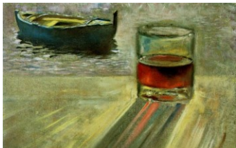
Ένα ποτήρι κρασί και βάρκα, πίνακας του Σαλβατόρ Νταλί, 1956

Όπως είναι γνωστό οι Βενετοί κατέκτησαν τη Λευκάδα, εκδιώκοντας τους Οθωμανούς, το 1684. Ωστόσο, κατά τον νέο βενετοτουρκικό πόλεμο του 1714-1718, το νησί καταλήφθηκε εκ νέου από τους Οθωμανούς τον Οκτώβριο του 1715 και παρέμεινε υπό οθωμανική κυριαρχία μέχρι τον Οκτώβριο του 1716(3). Υπό κανονικές συνθήκες η τιμή του κρασιού κατά την εποχή αυτήν πρέπει να εκινείτο κάτω από τις 20 λίρες ανά βαρέλα(4). Η υπερβολική τιμή, επομένως, των 26 λιρών το 1717 ήταν ασφαλώς αποτέλεσμα του πολέμου του 1715-1716 και της κατάληψης του νησιού. Πραγματι, εκτός από τις πιθανές καταστροφές στην παραγωγή, είναι λογικό να υποθέσουμε ότι μεγάλο μέρος της θα περιήλθε στους κατακτητές, οι οποίοι το ιδιοποιήθηκαν ως λάφυρο, όπως ήταν σύνηθες, και επομένως το προϊόν έλειψε από την τοπική αγορά και εκτόξευσε τη ζήτηση και για τον επιπρόσθετο μάλιστα λόγω της ενισχυμένης στρατιωτικής παρουσίας στο νησί από τον φόβο νέας εισβολής. Όπως φαίνεται από τα διαθέσιμα στοιχεία, η φρουρά του νησιού αριθμούσε στα 1717 1894 άνδρες, από τους οποίους μάλιστα οι 830 ήταν γερμανοί μισθοφόροι(5). Αν η δύναμη της φρουράς φαίνεται μικρή πρέπει να σημειώσουμε ότι στην άμυνα συμμετείχε και ο ντόπιος πληθυσμός, από