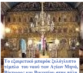
Το εξαιρετικό μπαρόκ ξυλόγλυπτο τέμπλο του ναού των Αγίων Μηνά, Βίκτωρος και Βικεντίου στην πόλη της Λευκάδας