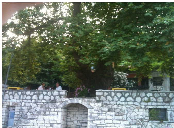
Η παλιά πηγή "Το Κανάλι" κάτω απ' τον πλάτανο

δεσπότης Νικηφόρος Α' την έδωσε ως προίκα στο Ιωάννη Ορσίνι, σύζυγο της θυγατέρας του Μαρίας. Το πέρασμα λοιπόν των αιώνων εξηγεί τον λόγο για τον οποίο η παράδοση έχασε όλα τα άλλα προσδιοριστικά της στοιχεία (χρόνος, συνάρτηση με άλλα γεγονότα, μορφή του οικισμού και κυρίως αναφορά στον επικυρίαρχο του νησιού). Έτσι ο πλάτανος γίνεται ο