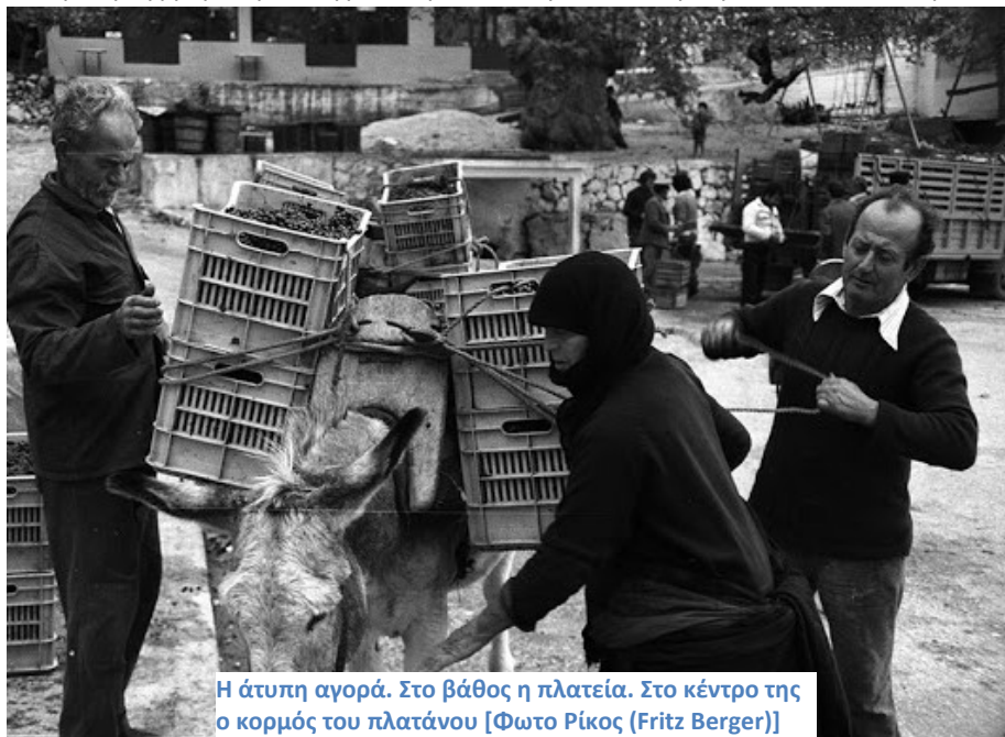
Η άτυπη αγορά. Στο βάθος η πλατεία. Στο κέντρο της ο κορμός του πλατάνου

Αυτικά από τον πλάτανο και παράλληλα μ' αυτόν διέρχεται ο κύριος οδικός άξονας του νησιού μας που συνδέει το χωριό μας με τους οικισμούς της βόρειας και της νότιας Λευκάδας και από την πρωτεύουσα του νησιού στο βορρά και τη Βασιλική στον νότο συνεχίζεται