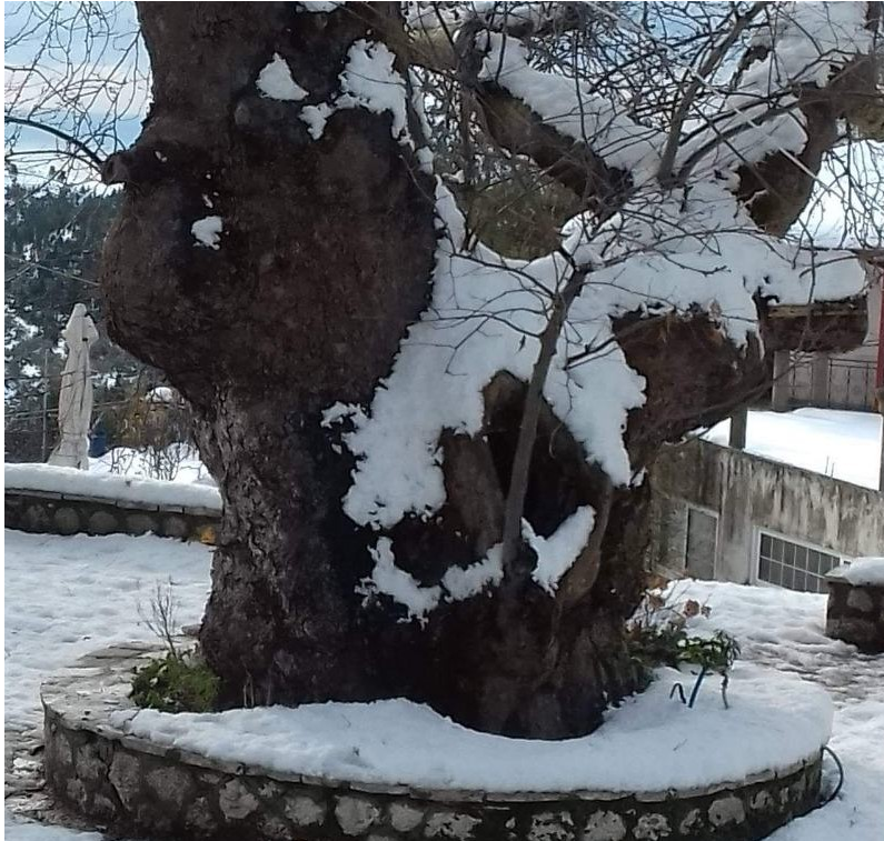
Περίμετρος: 7 μέτρα

Αν θα ήθελε κανείς να επισημάνει ένα εμβληματικό στοιχείο που προσδιορίζει την ταυτότητα του χωριού μας, έργο των ανθρώπων ή μνημείο, αν επιτρέπεται η έκφραση, της φύσης, όλοι πιστεύω θα συμφωνούσαμε ότι αυτό είναι ο αιωνόβιος πλάτανος στο κέντρο του οικισμένου χώρου. Πρόκειται για ένα επιβλητικό δέντρο, με ύψος δεκάδων μέτρων, που αναμετριέται με τους ανέμους, τις θύελλες και τις βροχές, στο αέναο γύρισμα των καιρών, βουβός μάρτυρας ενός κομματιού της ιστορίας του μικρού οικισμού μας, που συνδέεται με πρόσωπα και γεγονότα και τροφοδοτεί τη συλλογική μνήμη όσων γεννηθήκαμε και ζήσαμε, ένα τουλάχιστον μέρος της ζωής μας, σ' αυτόν. Γιατί, για να αναφέρω ένα παράδειγμα, στη συλλογική μας μνήμη εγγράφεται το πιο σημαντικό γεγονός της κοινωνικής και πολιτιστικής ζωής του χωριού μας σε περασμένες εποχές, δηλαδή το ετήσιο πανηγύρι στις 23 Αυγούστου, που οι εκδηλώσεις του είχαν κέντρο τη μικρή χωμάτινη πλατεία γύρω από τον πλάτανο.