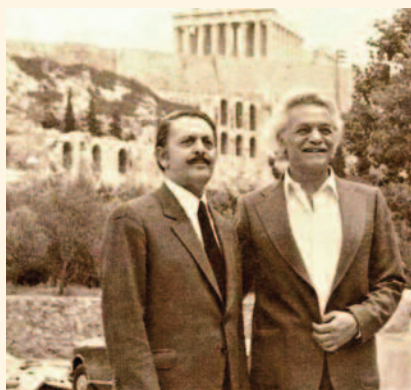
κόσμου σκουπίζει πάντα το ιδρωμένο μέτωπο της λευτεριάς, και της ειρήνης.

Αλήθεια, Ζολιό, πως να μη ντρέπομαι, πως να μη ντρέπεται ο κόσμος, Ζολιό, όταν ο Μανώλης ο Γλέζος, Ζολιό, κυττάει το φως μες απ' τα σίδερα, ο Μανώλης ο Γλέζος, Ζολιό, που ακόμη, με τα δυό του χέρια, σημαδεμένα απ' τις χειροπέδες, σκουπίζει πάντα τα κλαμένα μάτια του