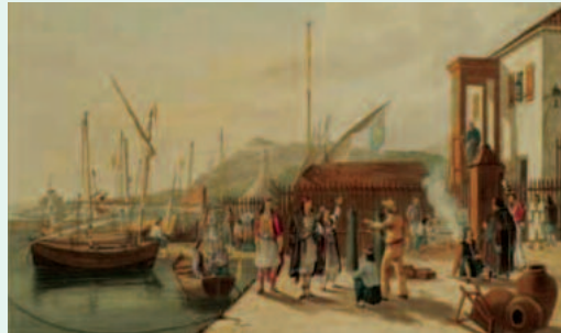
Το Υγειονομείο της Λευκάδας

Παράλληλα ελήφθησαν και κάποια μέτρα οικονομικής ελάφρυνσης του πληθυσμού και προστασίας από βίαιες πράξεις και πλιάτσικο. Διαμοιράστηκαν όπλα, θεομοθετήθηκαν φοροελαφρύνσεις και απαλλαγές, λόγω της μη μετάβασης στις καλλιέργειες εξ αιτίας του αυτοπεριορισμού.