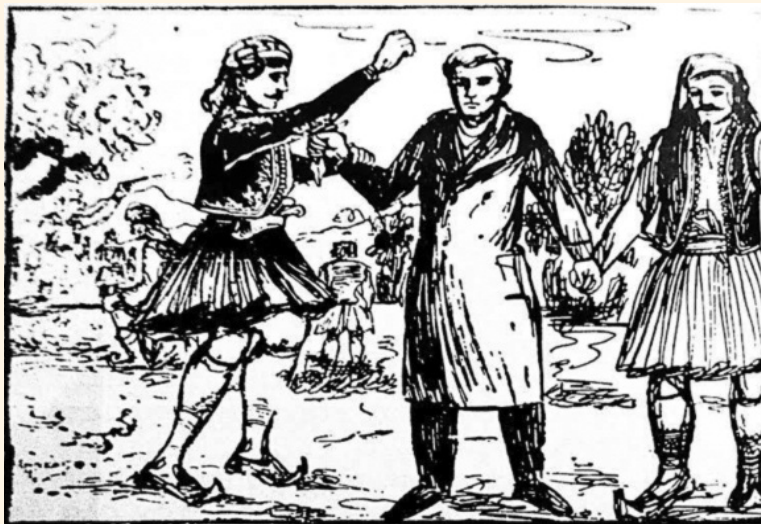
Στο γλέντι της Λευκάδας ο Καποδίστριας κρατάει τον Κασαντώνη που σέρνει πρώτος τον χορό

Το ανάτυπο μόλις εξεδόθη με την ευγενική χορηγία του συγχωριανού μας κ. Χριστοφόρου Ηλία