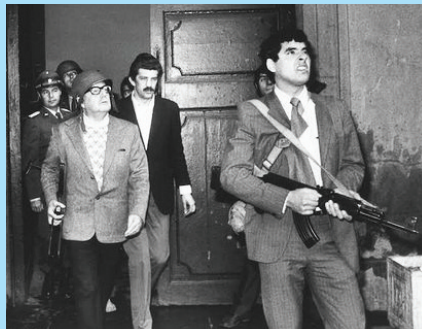
Μπροστά στο Προεδρικό Μέγαρο για να συναντήσει το θάνατο

στα τσιφλίκια ποδοπατημένα, Διαβολικό δραγουμιστές, σατράπες μύριες φορές πουλημένοι, ξεπουλητάδες βαλτοί, από τους λύκους της Νέας Υόρκης... Πεινασμένες για δολάρια μηχανές, σημαδεμένοι από τα θύματα των λαών που θυσιάσατε, εκπορνευμένοι μικροπωλητές ψωμιού κι αέρα αμερικάνικου, εγκληματικοί βούρκοι, συμμορίες από μαστροπούς μπόσσηδες δίχως άλλο νόμο απ' τα βασανιστήρια και την πείνα που μαστιγώνει τους λαούς...»