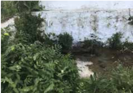
Η παλαιά βρύση το χειμώνα

Το τρεχούμενο νερό της μας χαρίζει η βρυσούλα και ο καθένας πατριώτης έτρεχε απ' την αυγούλα. Μια τα ρούχα της να πλύνει άλλη στάμνα να γεμίσει και μια Τρίτη σε κοφίνι τα προικιά της να νοτίσει. Ένας γάιδαρος περνάει ξεπεξεύει ο αναβάτης τις κυρίες χαιρετάει είναι και καλός εργάτης. Την αξίνα του αρπάζει και ξαρίζει το αυλάκι κούραση δεν λογαριάζει και δουλεύει από μεράκι. Το νεράκι οδηγεί μες τον λόμπο, να γεμίσει τον θεό μας ευλογεί που τον κήπο θα ποτίσει. Μ' ένα σκούβλο και ασβέστη μια γριούλα καταφθάνει αφηφά αυτή την ζέστη Την βρυσούλα άσπρη την κάνει.