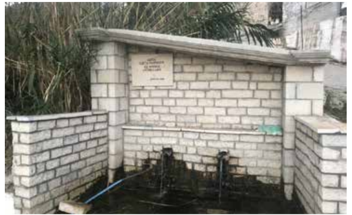
Η βρύση σήμερα