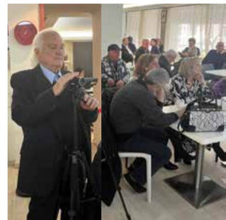
Πατρίκιος: Τελευταία βιντεοσκόπηση